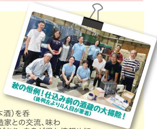
秋の恒例!仕込み前の酒蔵の大掃除! (後列左より4人目が筆者)

実は、私の日本酒に関する関心はこれだけに留まらず、日本酒の酒蔵が販売量の減少や後継者問題などで廃業していく状況を憂える仲間たちと一緒に4年前に「小さな酒蔵未来経営研究会」という一般社団法人を立ち上げました。この団体の主な活動は、地方の小さな酒蔵さんの経営改善のためにマーケティングやブランディングを蔵主さんと一緒に考えて行動に移していくというものです。本業がある中でこうした活動をするのも大変ですが、蔵主さんや杜氏さんと日本酒のお話をしている時も至福の時なのだと思っています。