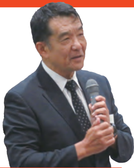
挨拶する白谷会頭

10月3日(木)、第7回常議員会、第5回臨時議員総会を開催し、新しい委員会の発足や一人親方組合の設立など、本所重要案件が承認された。