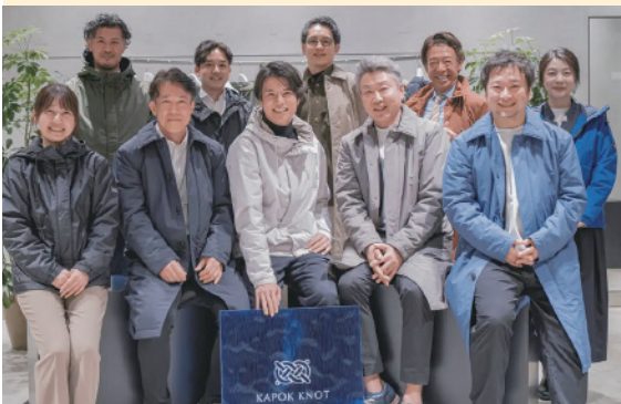
(後列右から2人目が筆者)

人は生まれる時は一人であり、死ぬときも一人である。その人生において出会える人数は知っている。しかしながら、自分の人生の中で、肉親、家族を含めてご縁を頂き影響を受けた恩顧のある人々は数えきれない。その素晴らしい人々と次の成長を求めて邂逅を深める時間を持つ。それこそが、私にとって何物にも変えられない深い喜びを授けてくれる至福の時である。次の新たなる至福の時を求めて、さらなる出会いをいただき、良い汗をかいていく所存である。