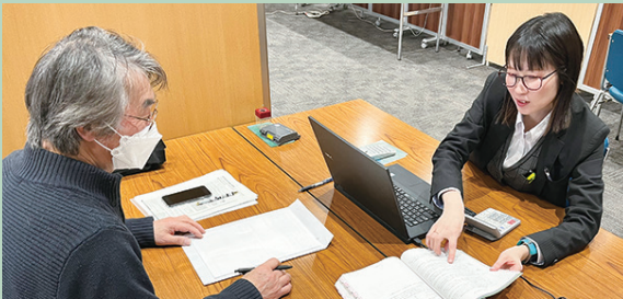
【問合せ】本所経営支援課 TEL：23-1111

本所では、引き続き個人事業主の方を対象に、個別の相談対応いたします。ご相談の際は事前にご連絡いただきますようお願いいたします。