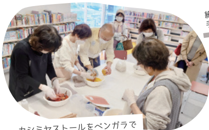
カシミアストールをベンガラで 染めるワークショップ

6月は、SASAWASHI の商品をピックアップし、 販売します。ささや紙の布 は、くまざさを漉き込んだ 和紙を細長くカットして、 撚りをかけて糸にし、布に 織り上げています。「ささ