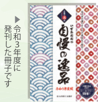
▶令和3年度に 発刊した冊子です