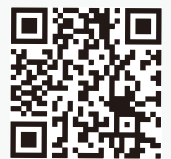
生産性革命推進事業