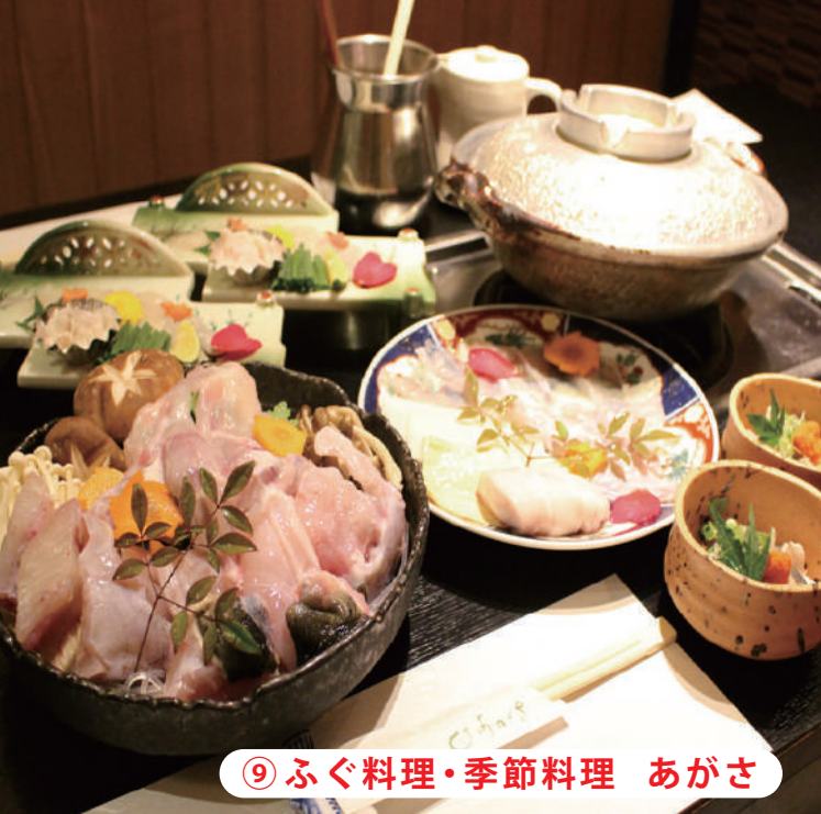
⑨ ふぐ料理・季節料理 あがさ