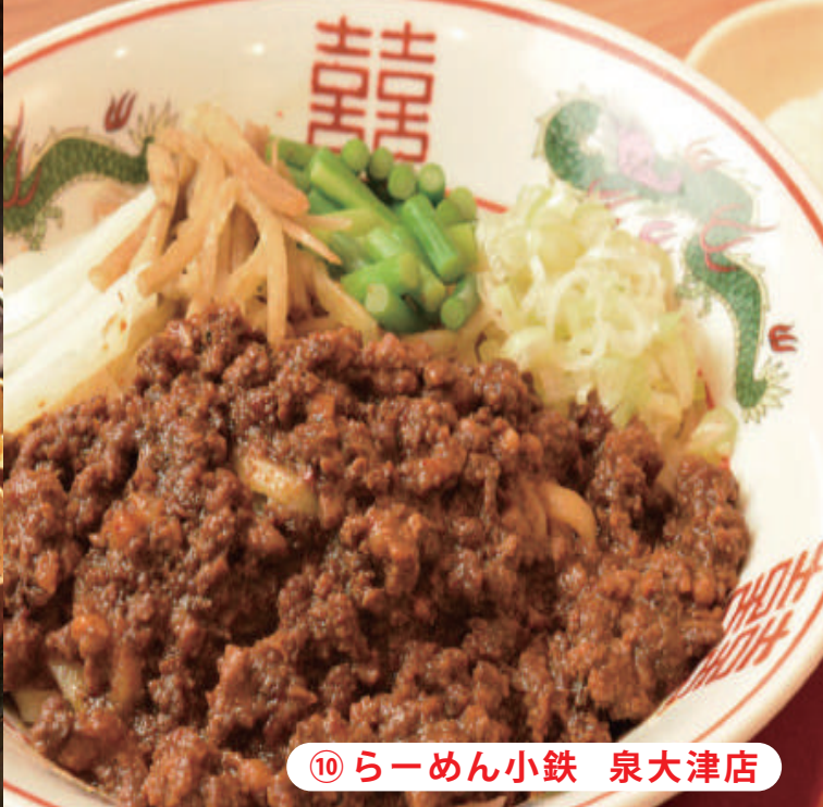
⑩ らーめん小鉄 泉大津店