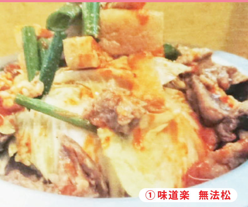
① 味道楽 無法松