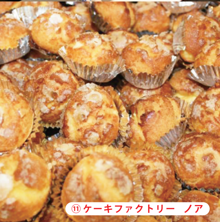
⑪ ケーキファクトリー ノア