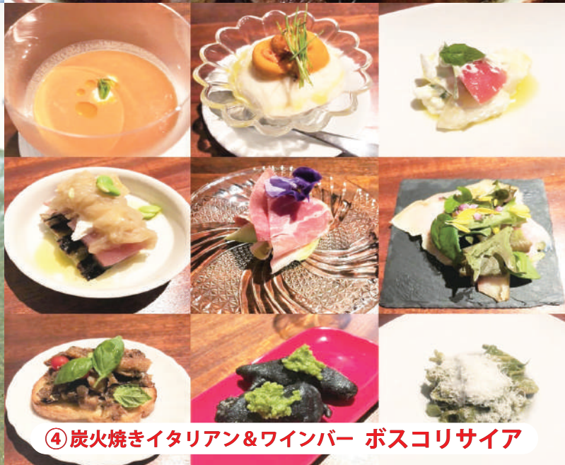
④ 炭火焼きイタリアン&ワインバー ボスコリサイア