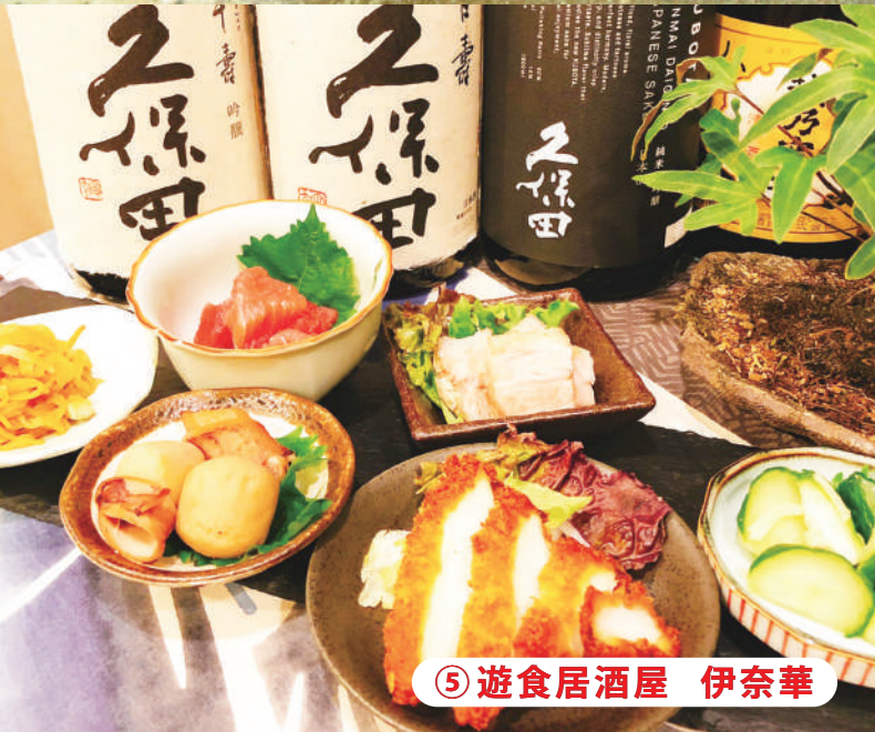
⑤ 遊食居酒屋 伊奈華