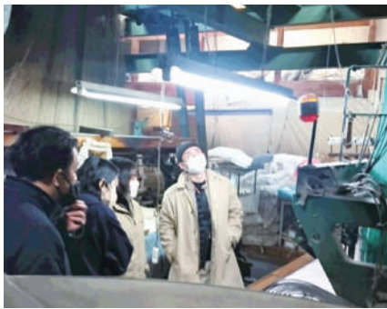
日の出毛織を見学

くり」をテーマに講演会を開催、40余人が参加した。講演会では、全国各地のストーリー性のある製品との出会いや、今まで無かったユニーク商品の開発など、両氏の経験や事業内容を中心に話を展開し、さらに今後の泉大津の地場産品の可能性について熱く思いを語った。また、質疑応答では、「部下のバイヤーに対する無茶な指示内容は？」などの質問にもユーモアに富んだ回答を展開し、他では聞けない講演内容となった。