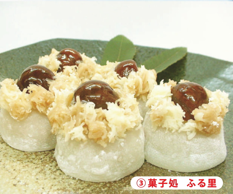
③ 菓子処 ふる里