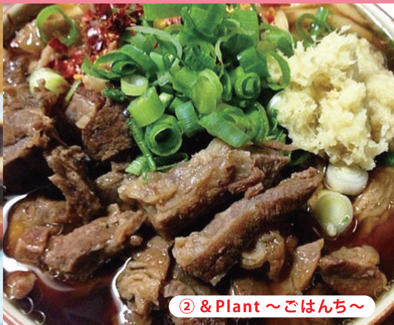
② & Plant ~ごはんち~