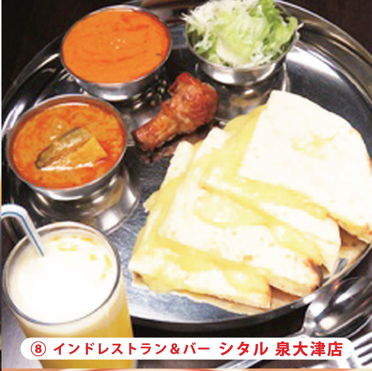
⑧ インドレストラン&バー シタル 泉大津店