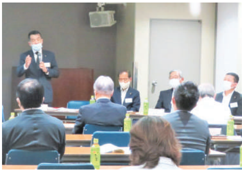
冒頭あいさつする白谷会頭

本所は令和元年度事業活動の総括審議を行う通常議員総会を6月23日、本所大ホールで開催し、事業報告、収支決算が承認された。元年度も多彩な事業展開を図ったが、特に年度の後半は、新型コロナウイルス感染症拡大に伴う国や大阪府の給付金、支援金そして特別融資の相談窓口を開設し、さらに独自に実施した緊急経済対策事業を報告した。 ものづくり(マネジメント) 当地の繊維製品を東京での展示会に出展し、泉大津のものづくりを強力に発信した。 また、多彩な研修会・研究会を開催。