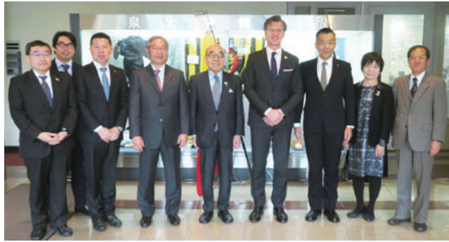
在日リトアニア大使(右から4人目)を囲んで記念撮影 大使の右が臼谷会頭、白石氏 大使の左が澤田名誉会頭