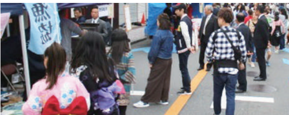
商連わいわいフェスタ

「おづみんフェスタ」「スイーツセレクション」は、泉大津YEG(青年部)が企画運営したもので、各企業や店の商品の展示即売会を実施した。早々に売り切れる店舗があるなど、大盛況のうちに終わった。また、今回はキャッシュレス決済推進事業の一環として、Pay Payブースを設置。キャッシュレス・QRコード決済でらくらくお買い物をしている姿がみられ、キャッシュレス決済推進に一役かった。