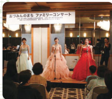
昨年のコンサートの模様