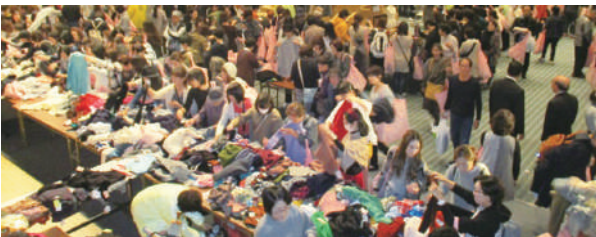
ニット謝恩セール

北助松商店街で開催された「商連わいわいフェスタ」は、歩行者天国でのお祭り。多くの模擬店やイベントが開催され、今年は“REIWA盆ダンス”で盛り上がりを見せた。来場者からは「女性向きのワークショップが多くて楽しかった」との声があった。