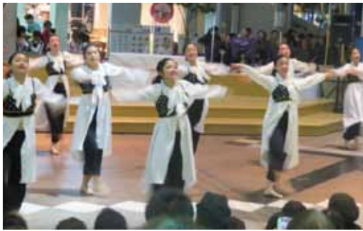
ダンスサミットの模様

11月3日・4日、泉大津駅東側、N・K・L・A・S・S周辺恒例の未来ビジョン各イベントを実施した。ならば駅でチラシを見たとき、家族連れは焼き立てさんまとお目当て。また、各店自慢のグルメやスイーツの食べ歩き、子供たちのダンスが楽しみといった方など、市外からもたくさん訪れ、各会場は朝早くから夕方までたいへんな賑わいを見せた。