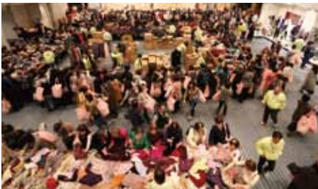
ニット謝恩セール

そして、メインイベントとして、「おづみんフェスタ」「OZU-1グルメグランプリ」「泉大津さんま祭り」の3つのイベントを、泉大津駅N.KLASS前及び難波側高架下で合同開催し、たくさんの来場者で賑わった。