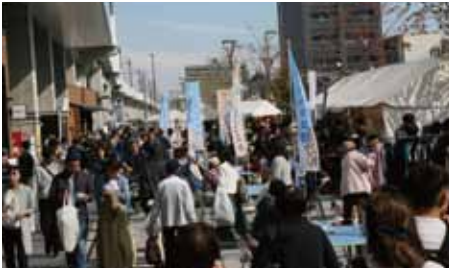
おづみんフェスタ

また、4日も多彩なイベントを開催。まず「ニット謝恩セール」がテクスピア大阪で開催され、市外からの来場者も多く詰めかけ、自分のお気に入りのセーターをたくさん購入していた。