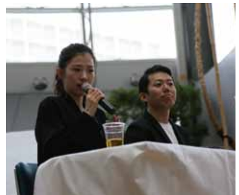
NHK連続テレビ小説「まんぶく」出演者

「おづみんフェスタ」は、泉大津YEG(青年部)が企画運営したもので、各企業やお店の商品の展示即売会を実施し、昨年度に引き続き行われた「OZU-1スイーツグランプリ」では、市内製菓・飲食店8店舗の自慢のスイーツを販売。「和菓子司 ぽんぽんや」のくるみもちが、見事2連覇！！グランプリに輝いた。(下記で紹介)