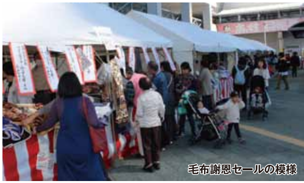
毛布謝恩セールの模様