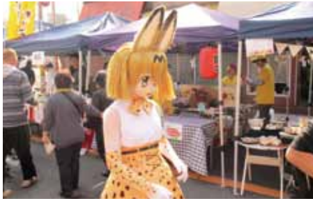
商連わいわいフェスタ

泉大津未来ビジョン協議会では、11月4日・5日の2日間にわたり、各イベントを開催した。