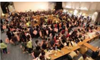
ニット謝恩セール