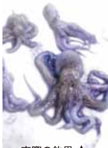
実際の釣果 ▲ 見かけはグロいが味は最高!!

タコエギをキャストしてずると底をはわせながらリールを巻きましょう。岸壁の際をタコジグで探るのもOK。