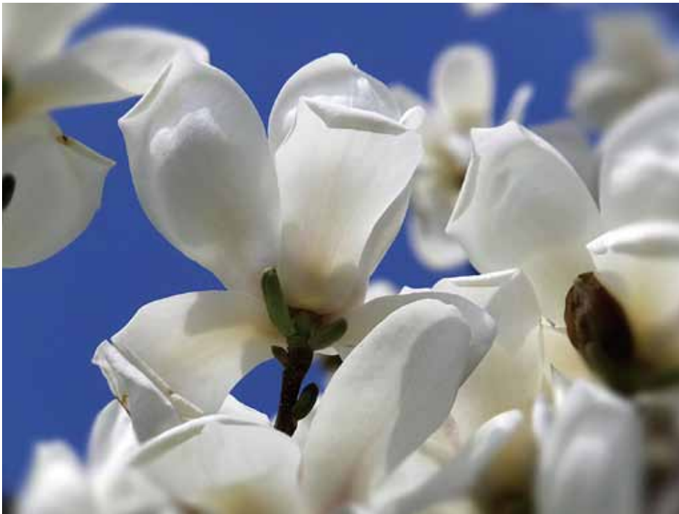
〔4月の花〕 白木蓮 (ハクモクレン)