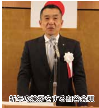
新年の挨拶をする自谷会頭