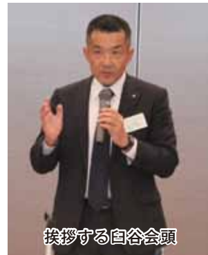
挨拶する自谷会長