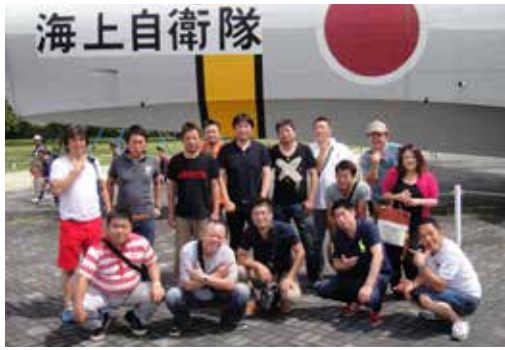
各務原航空宇宙科学博物館前

泉大津市我孫子 1-2-47 ホワイトビル1F TEL: 0725-21-7290