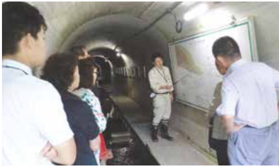
排水トンネル内で説明を受ける一同

まず訪れた「亀の瀬地すべり対策工事現場」は、大阪府と奈良県の境に位置している。古くより地すべりが起きる地域として恐れられており、昭和37年から建設省（現国土交通省）の直轄事業として、国が最先端の技術で対策工事を実施し、近年では地すべりがほとんど起こらなくなっている。