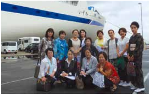
阪九フェリー新鋭船「いずみ」

大阪府商工会議所女性会連合会は9月29日、旧桜宮公会堂に府下14商工会議所152人