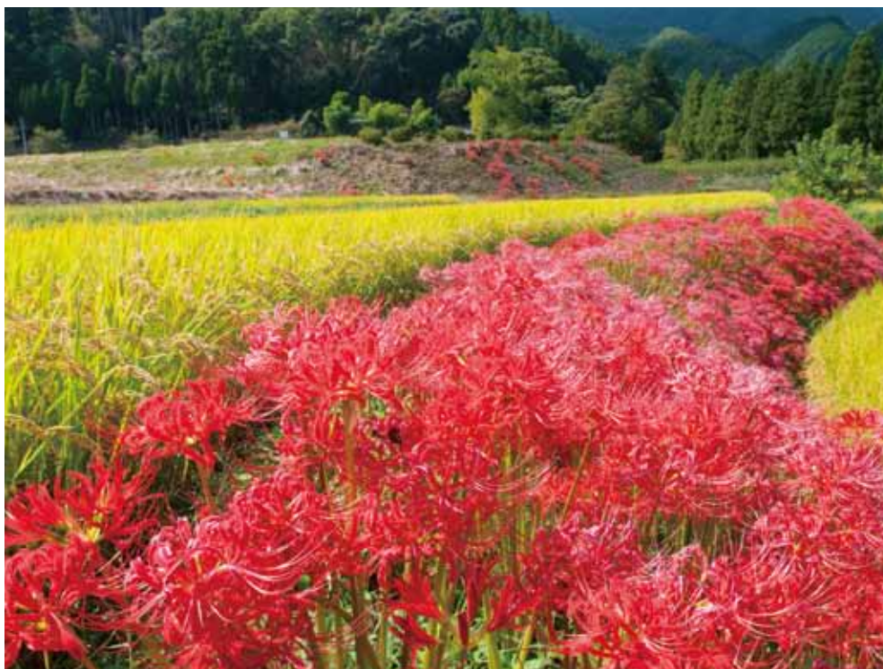
【9月の花】彼岸花(ヒガンバナ)